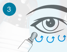
Opklar og mindsk hævelse

Pres og løft huden inderst, midt og yderst på brynbenet. Løft huden i 1-2 sekunder. Lad applikatoren glide langs huden under øjet og tilbage til brynnet mellem hvert løft. Gentag 3 gange på hvert øje.